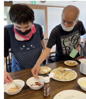
ワッフルのデコレーション☆