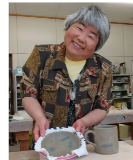
陶芸に挑戦！ コップとお皿が 上手に出来ました。