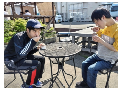
宮崎公園つつじ祭り