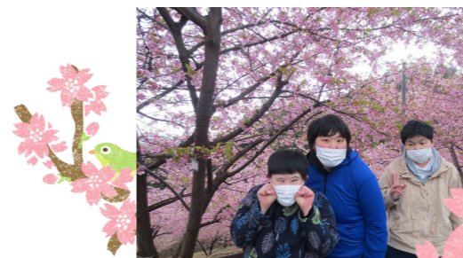
おやつを持って 満開の桜も見ってきました☆