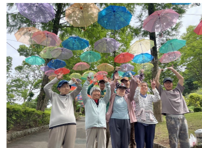
甘楽町総合公園「アンブレラスカイ」 を見に行きました。 約70mの傘の道は幻想的でした☆☆