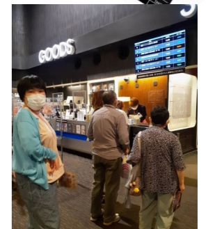
高崎イオンで映画鑑賞♪