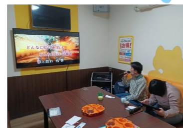
コロナ禍では施設内のカラオ ケセットで歌っていましたが、 カラオケBOX 解禁です!!