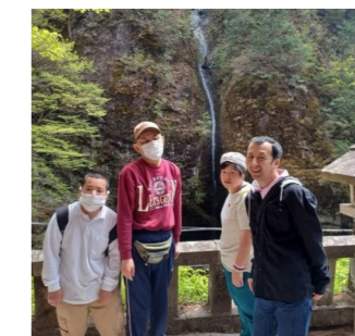
関東屈指のパワースポット！ 榛名神社へ行ってきました。