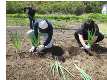
今年も畑にたくさん 野菜を植えました！！