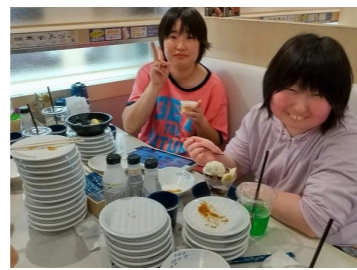
ホームで夕食外食。