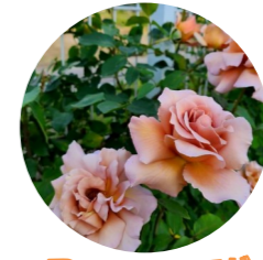
フェンスのバラが とてもキレイに咲きました