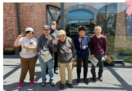
世界遺産センター「セカイト」を見学し、 富岡製糸業について学びました。